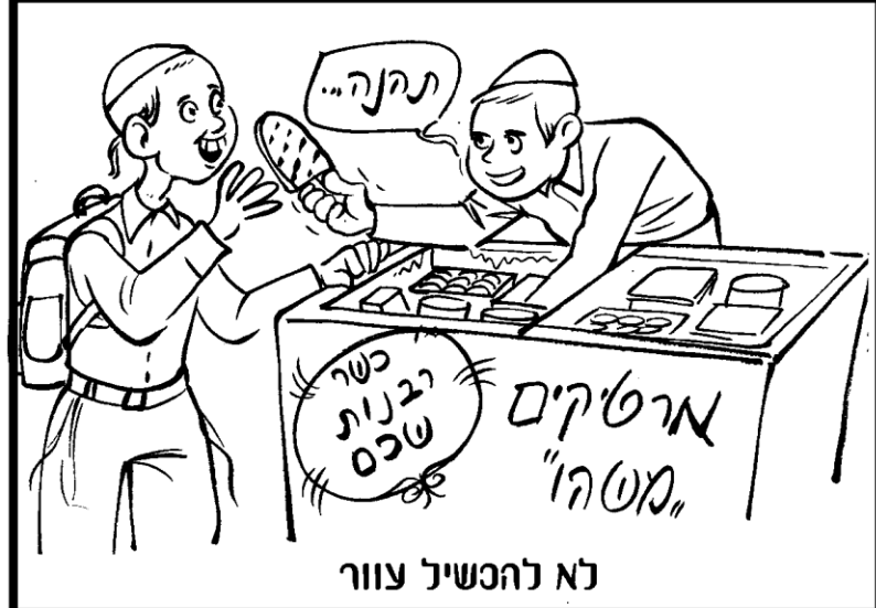
לא להכשיל צוור