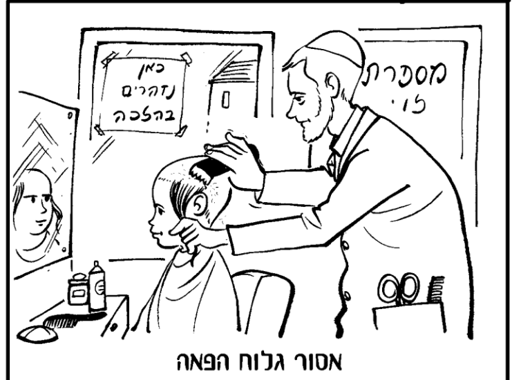
אסור גלוח הפאה